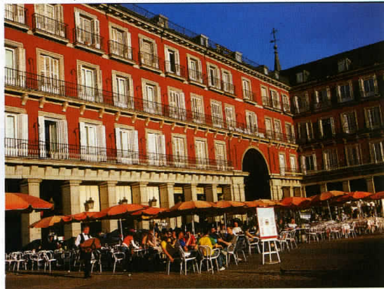
A Salamanque, flânez sur la Plaza Mayor, belle place à portiques, la plus importante par sa taille et l'une des plus agréables d'Espagne.