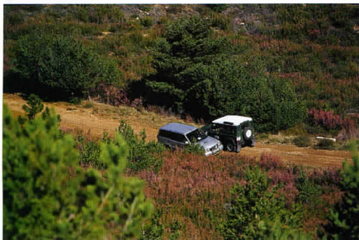
La Sierra de Gredos est l'une des régions les plus sauvages et les moins peuplées d'Espagne. C'est un excellent environnement pour la randonnée.