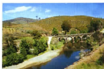
Dans les nombreux parcs naturels, l'eau est un élément fondamental.