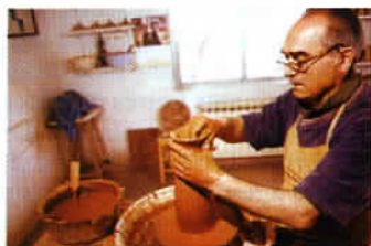
La céramique, l'activité artisanale la plus caractéristique de Cuenca.