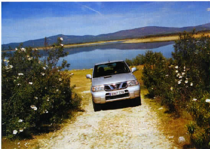
L'Espagne est sans doute le pays d'Europe occidentale le mieux préservé en matière d'espaces naturels, de faune et de flore.