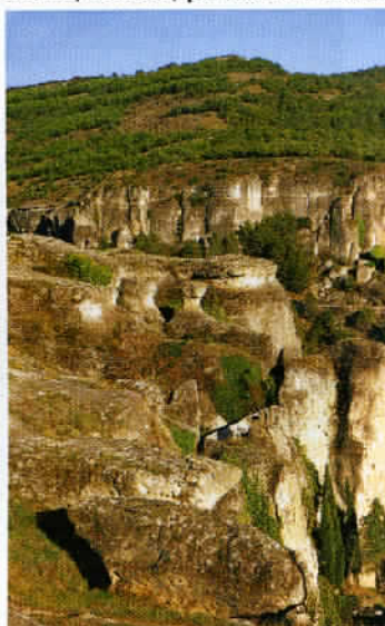
Cuenca a été bâti sur une colline, entre deux profondes gorges.