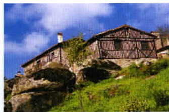
La Alberca, l'un des plus beaux villages d'Espagne.