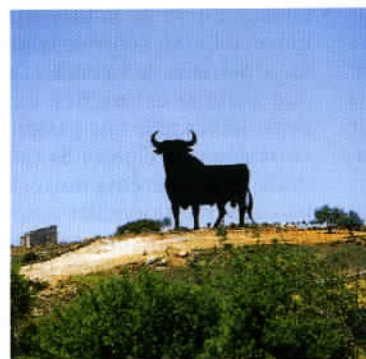
Sur la crête des collines, le taureau Vétéran veille depuis des générations.