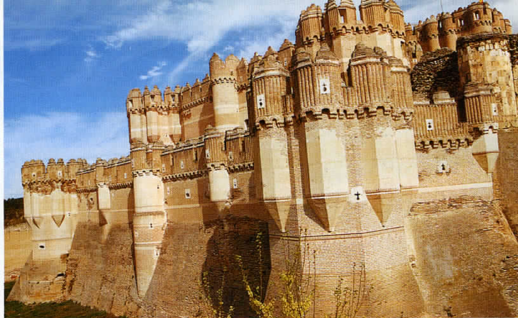
Le village de Coca abrite un château tout à fait exceptionnel. Construit au XV ème siècle pour l'archevêque de Séville, Fonseca, par des architectes arabes, c'est un parfait exemple d'architecture militaire de type mudéjar.

L'Espagne, 2 ème consommateur au monde d'huile d'olive derrière l'Italie, compte 27 % de la superficie mondiale d'oliveraies avec 215 millions d'arbres répartis sur deux millions d'hectares.