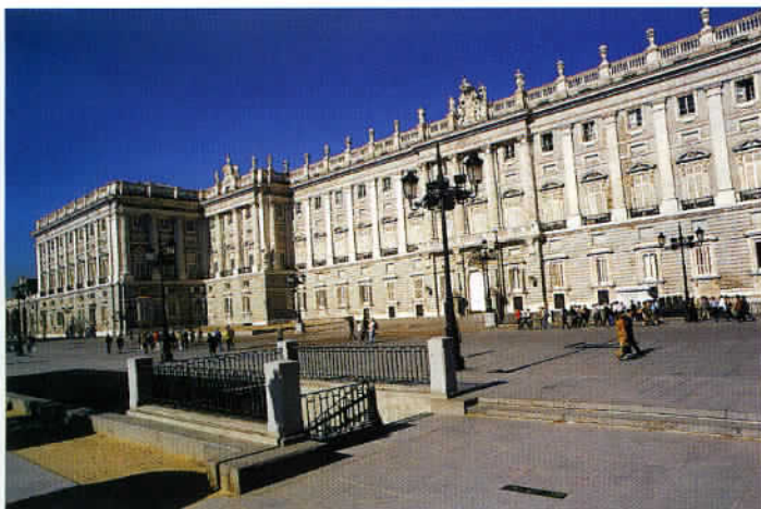
Le Palais Royal de Madrid, construit sur l'ancien alcazar des Habsbourg, allie le style baroque à la tradition des résidences royales espagnoles.