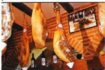
Le jambon de Guijuelo, délicieuse spécialité régionale.