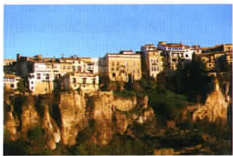
La ville fortifiée de Cuenca, classée patrimoine de l'humanité.