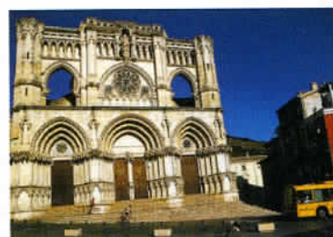
Cathédrale de Cuenca, de style gothique, avec des influences anglo-normandes.