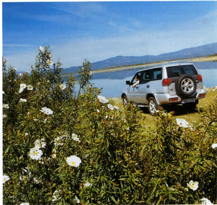
Castille et Léon, province la plus étendue de l'Union européenne, s'articule autour du bassin du fleuve Douro, le plus grand d'Espagne.